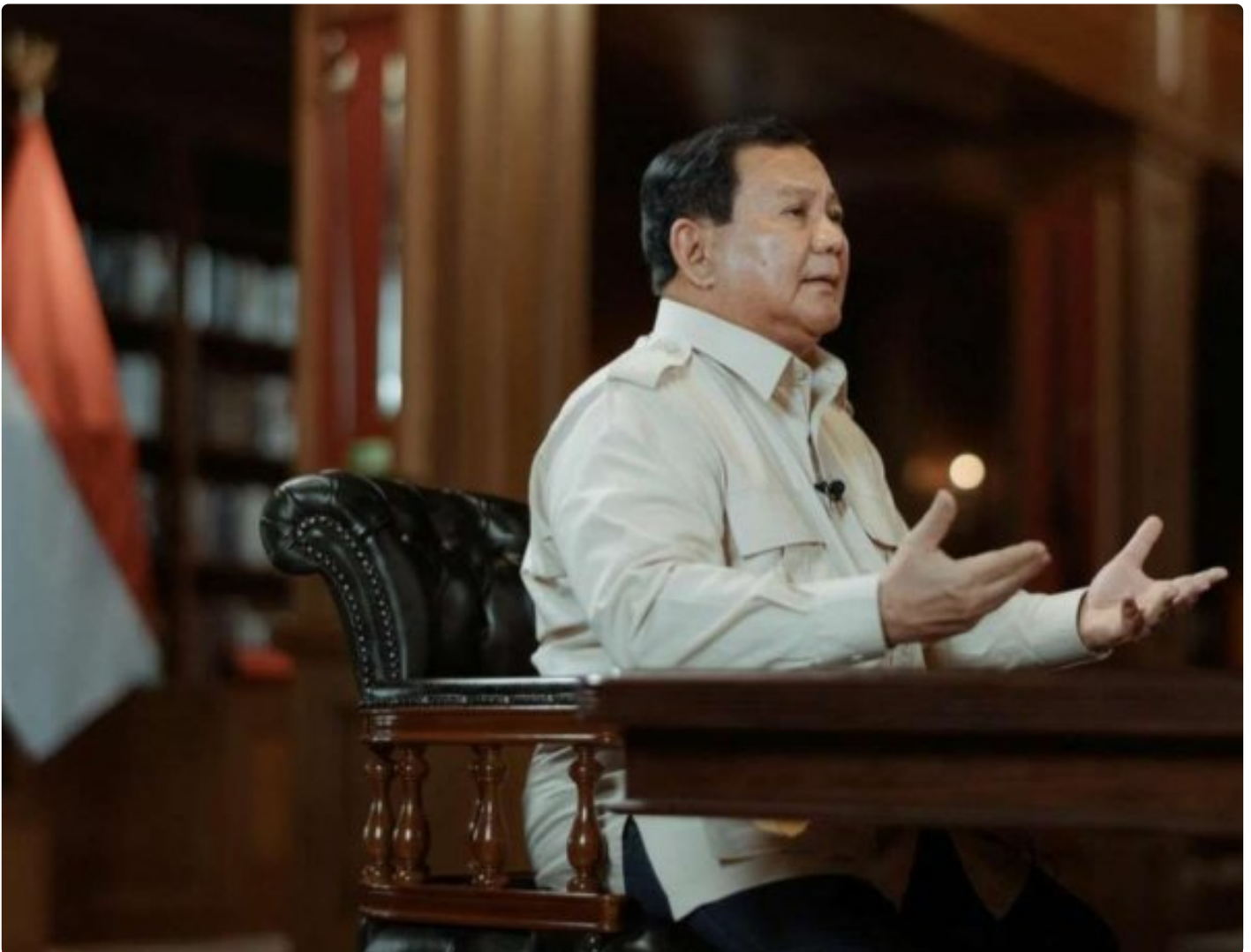
Prabowo Subianto Presiden RI 2024-2029

PENDIDIKAN - Indonesia dikenal sebagai negara yang kaya akan sumber daya alam. Dari hasil tambang yang berlimpah, laut yang luas dengan kekayaan hayati